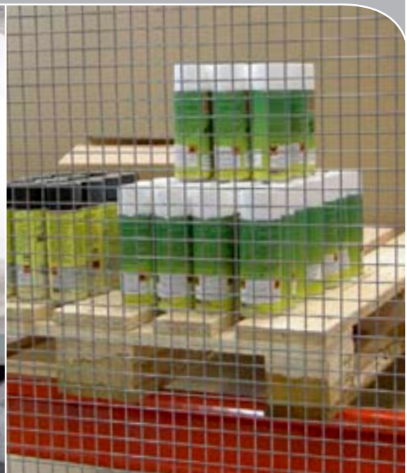
Bild oben: Trennwandsystem an einer Laderampe im Außenbereich. Bild rechts: Troax garantiert Einbruchssicherheit bei der Aufbewahrung von gefährlichen, chemischen Stoffen